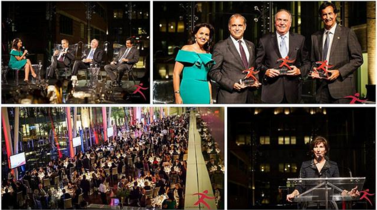
Gala annuel de La Gouvernance au Féminin - 14 septembre 2016.